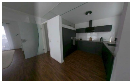
Bild in 3D-Ansicht mit evtl. personenbezogenen Daten z.B. Bilder an der Wand.

Aufnahme bei Ihnen vor Ort über den „3D-Laserscanning“