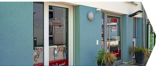
Nachbarschaftstreff Am Schönen Rain